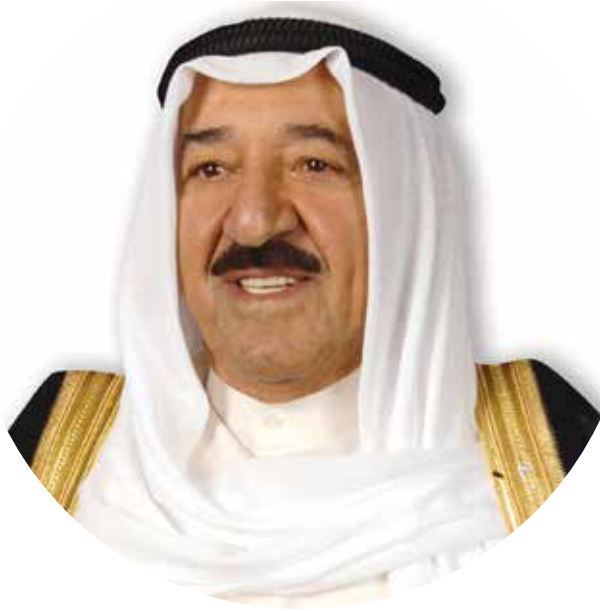
حضرة صاحب السمو الشيخ صباح الأحمد الجابر الصباح أمير دولة الكويت